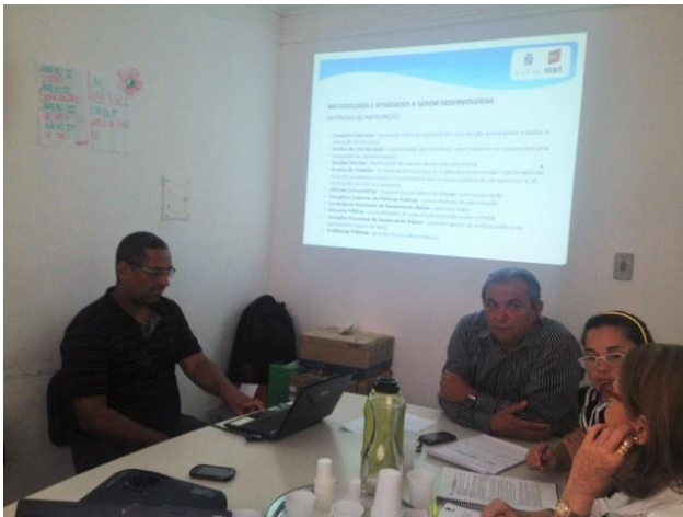
Figura 1. Reunião Técnica com membros da Start e do Conselho Executivo