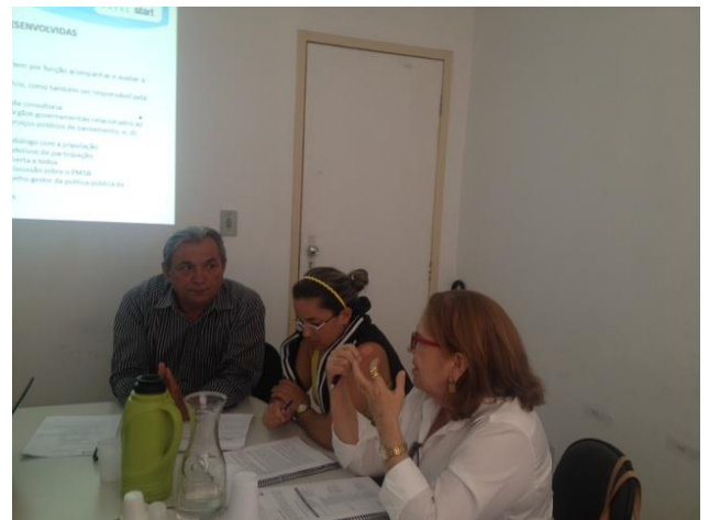
Figura 2. Reunião Técnica com membros da Start e do Conselho Executivo