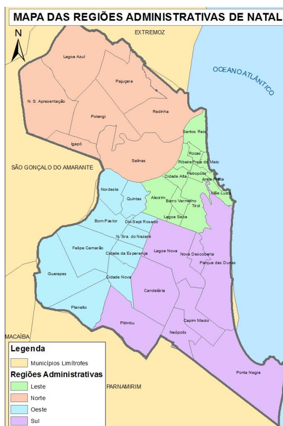
Figura 1. Mapa das Regiões Administrativas de Natal

O território municipal é dividido em 36 bairros, agrupados em quatro regiões ou zonas administrativas, conforme apresentado nas Figuras a seguir.