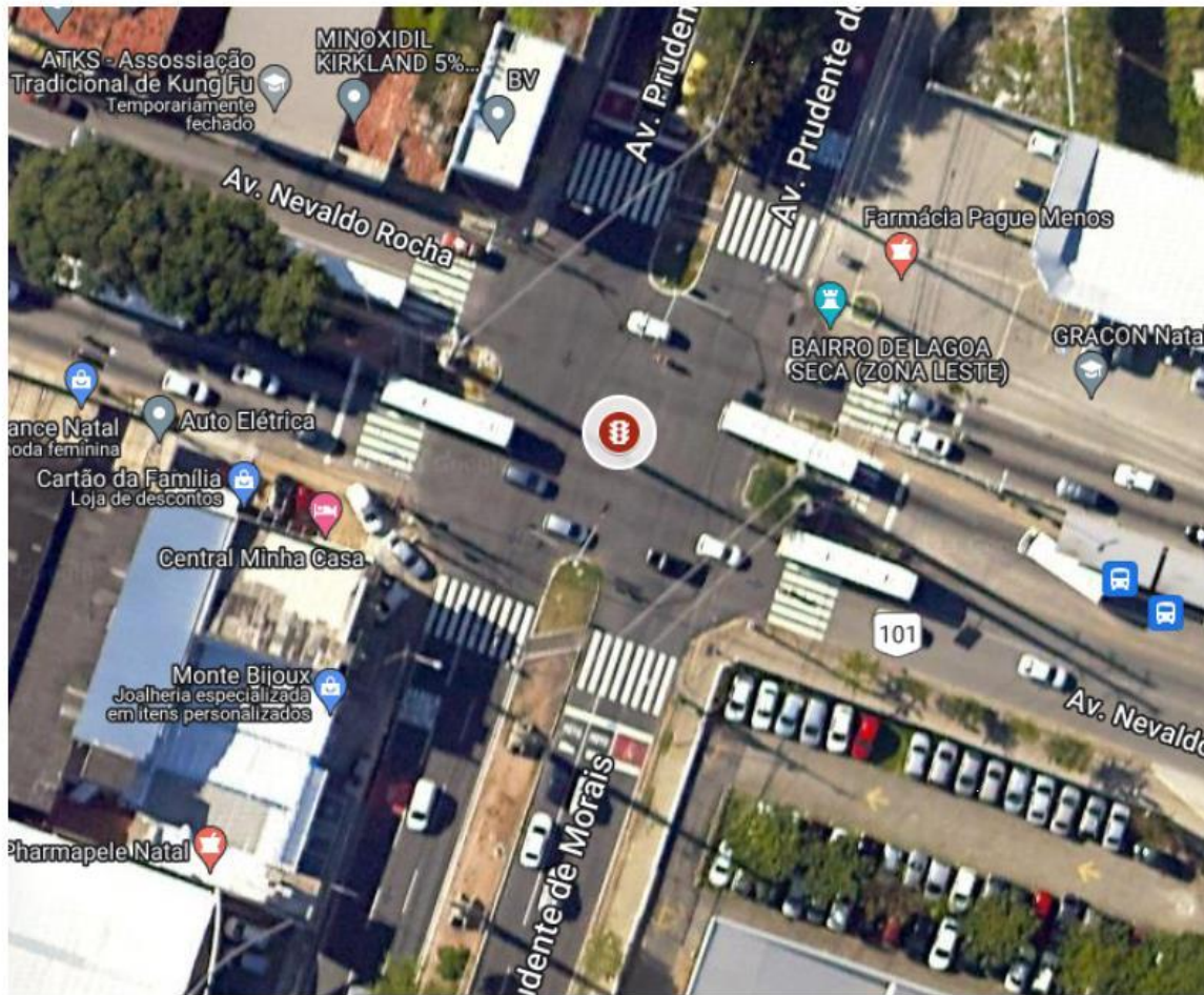
Figura 1 - Vista Superior